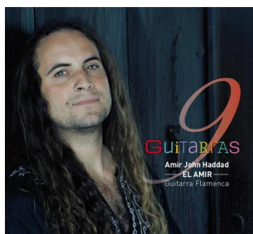
"9 GUITARRAS", 2013